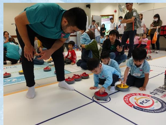
度假營裏有不同的設施，與朋友家人一起遊玩！你看！我們正學習冰壺遊戲的玩法。