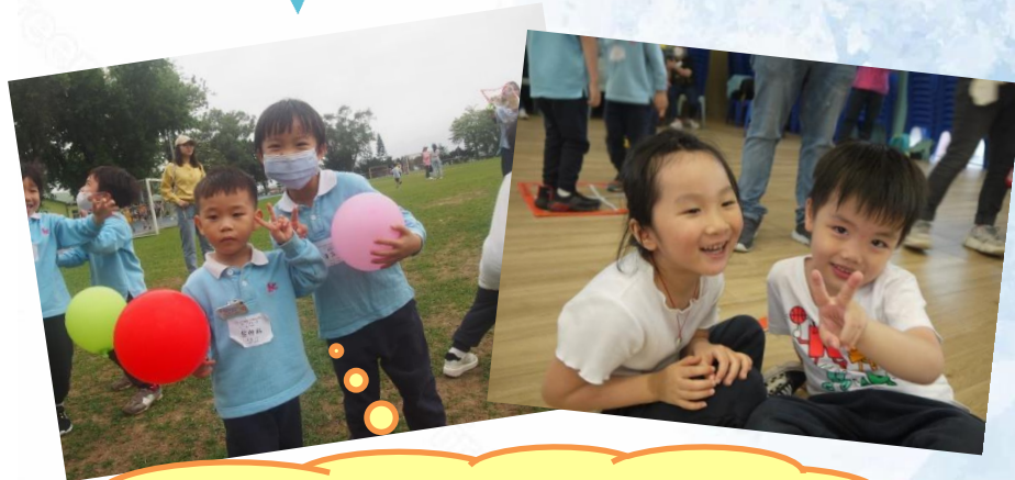
與好朋友一起開心合照！